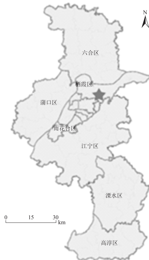
图 1 仙林新村在南京市的位置

镇空间扩张较快,失地农民分布范围较广且总量较多;而城乡结合地带是城镇空间扩张的前沿地区,也是失地农民集中出现的区域。为此,本文选择位于南京市近郊区的仙林新村作为研究区域。